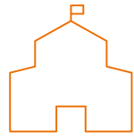
Bedrijfsmatig onroerend goed