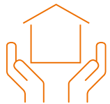
Maatschappelijk onroerend goed